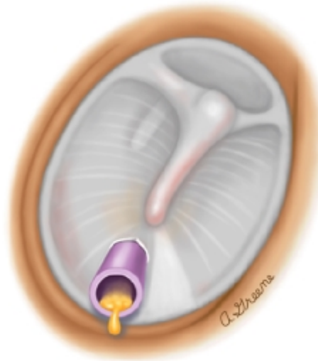
El líquido del oído medio sale a través del tubo

Esta cirugía podría hacerse cuando hay líquido en el oído medio que no se elimina. Este tratamiento también puede usarse para prevenir infecciones de oído futuras en los niños que las padecen a menudo. En el gráfico de la izquierda se observa el tímpano antes de que se inserte el tubo. En el gráfico de la derecha se observa la salida del líquido del oído medio de un niño que desarrolló una infección de oído tras la inserción del tubo.